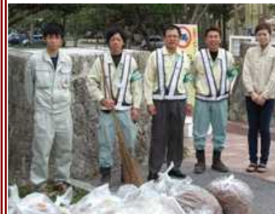
「張りの切りすぎではぐれてしまいました」