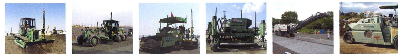
●ブルドーザ ●モータグレーダ ●アスファルトフィニッシャー ●スリップフォームペーバ ●切削機 ●転圧管理システム