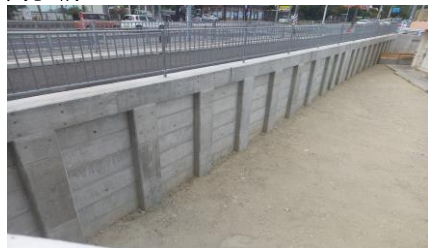
▶自立式親杭土留擁壁完成