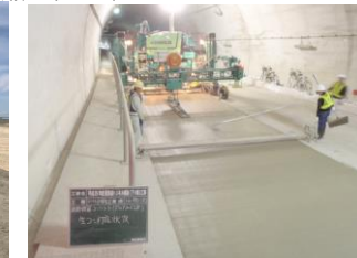
▶豊見城トンネル コンクリート舗装施工状況