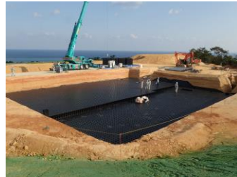
▶OIST雨水貯留槽工事施工状況