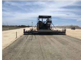
▶那覇空港路盤工施工状況 (3DMC)