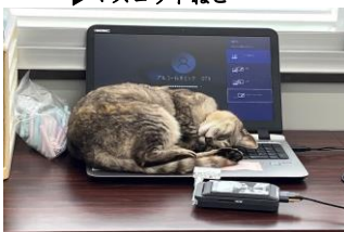
▶今日もご安全に! いってらっしゃいZzz...