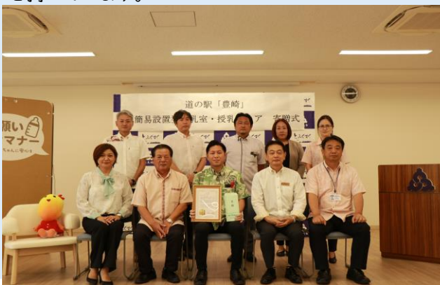
▶関係者との記念撮影写真

また、授乳サポートチェアは、お子様へ授乳される際、ゆったりとお座りいただき、授乳のサポートをする目的を持っています。