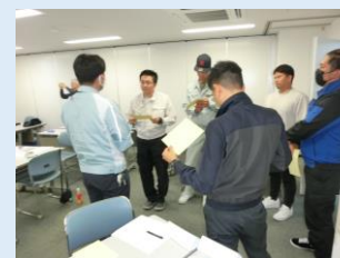
▶プレゼントカード進呈