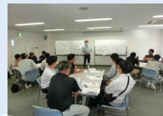
▶グループワーク発表

受講者からは〇コミュニケーションの大切さを再認識した〇普段の講習会と違い対人能力の向上を図ることができた〇先輩方がたくさんいてすごい勉強になりました〇自分の長所を知ることができた為非常に良い体験ができました〇色々な人の話が聞けて為になったなどの感想がありました。