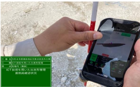
▶図1. 3次元モデルの活用