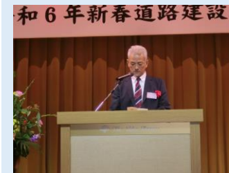
▶前川部長 来賓挨拶