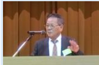
▶与那嶺支部長 挨拶