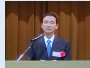
▶河南次長 来賓挨拶