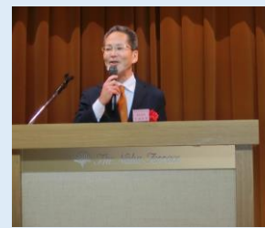
▶大城技術企画官 乾杯挨拶