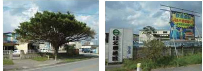
シンボルのガジュマル