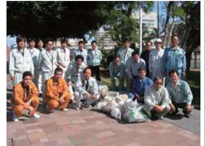
本日のゴミは少ないのかな？

第87回道路美化清掃活動を、11月19日(火) に15社19名の参加で実施しました。昨日 までの寒気が和らぎ、時折太陽が顔を覗 かせる好天となり清掃作業は順調に進み 、無事終了しました。