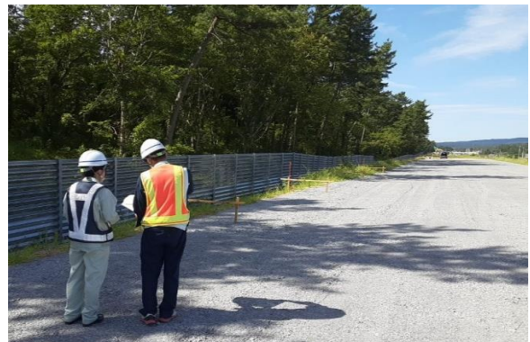
現地での施工内容説明