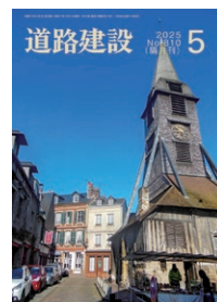
【表紙写真】 オンフルール（フランス）