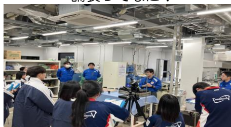
・技術研究所での試験作業