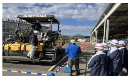
・疑似舗装体験、乗車体験