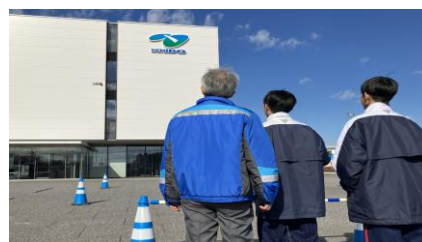
・ドローン操縦体験