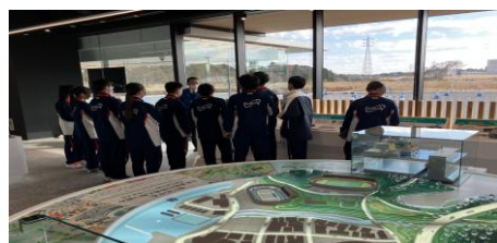
・ショールーム体験